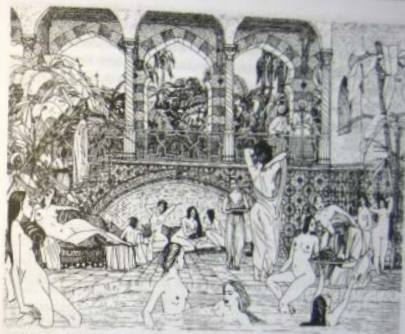
Гарем — дом радости

При особом усердии калфы могли добиться статуса «пейк» и тем самым приблизиться и стать помощницей и доверенным лицом обладательницы высших титулов. Пейкам платили очень хорошее жалование, гораздо больше, чем опытным калфам. Их обязывали уважать все остальные наложницы. Этот статус соответствовал почти максимальной позиции в иерархии гарема, которой могла добиться служанка, не имевшая права на отношения с султаном.