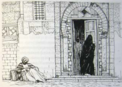
Проводив женщин, ревнивый муж терпеливо дожидается их у входа в баню

По мнению ранних исламских богословов, женские козни могли быть неисчислимы и искусны. Своими хитростями они превосходили порою самого шайтана, ибо Аллах всемогущий в стихах двенадцатой суры Корана показал, насколько велик дар вероломства женщин.