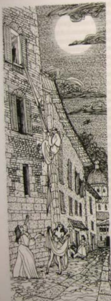
Филиппо ночью сбегал через окно

которые ему понравились, он готов был отдать последнее ради возможности ими обладать 19 .