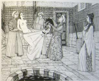
Пытка начиналась, когда женщину в мешок с кошками погружали в воду

помещали одну или несколько разъяренных кошек и завязывали так, чтобы животные не могли выбраться. Пытка начиналась, когда женщину погружали в воду. Кошки сходили с ума от страха и в панике начинали яростно терзать плоть несчастной жертвы» 28 .