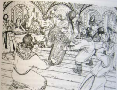
Потеха со сватьей

В то время, когда молодые удалились на брачное ложе, гости инсценировали песню про жену тысяцкого — сватью.