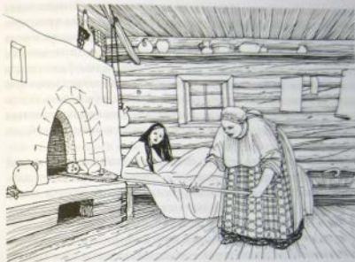
Пропекание в печи

Послеродов повитухи перевязывали пуповину новорожденных детей материнским волосом. Это обеспечивало крепкую связь матери с младенцем. Затем перетавшую пульсировать пуповину обрезали и разглаживали ребенку ручки, ножки, животик и «правили» головку. Для ослабленных детей существовала процедура «пропекания». Материнская утроба считалась своеобразной печью. И если ребенок там «не допекся», то его на лопате трижды помещали внутрь остывающей печки, полагая, что после этого он будет более сильным и крепким. Затем малыша обмывали и подносили к материнской груди. По окончании этих родовых процедур с отца снимали рубаху и заворачивали в нее новорожденного младенца, устанавливая его связь с отцом. Поверх отцовской рубахи надевали вывернутый шерстью наверх кожух и обносили новорожденного вокруг дома, приобщая к родному очагу и семье.