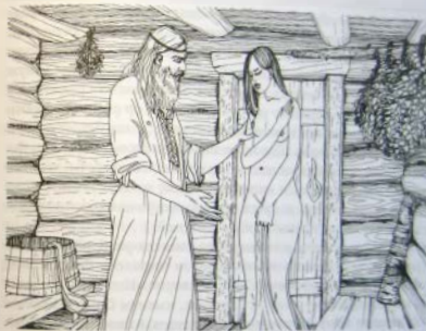
Уложив в бане

члены рода, а уж затем она передавалась жениху». Такое право князя или его наместника на первую брачную ночь с молодой невестой было заменено княгиней Ольгой специальным налогом, о чем упоминал В. Н. Татищев: «...отменила Ольга княжий обычай, а уложила брать от жениха по черной кунце как князю, так боярину от его подданного» 34 .