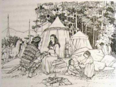
Хильдегарда сопровождала мужа во всех его походах