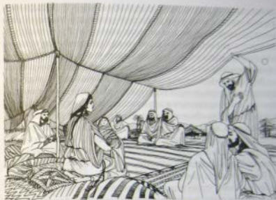
«Все вы знаете, что сделали, и я родила, и это твой сын»

Четвертый вид: собиралось много мужчин, и все они входили к женщине, и она не отказывала никому из них. Это были блудницы, и они вешали над своими дверями флажок, который служил знаком для мужчин, и к ним входил любой желающий.