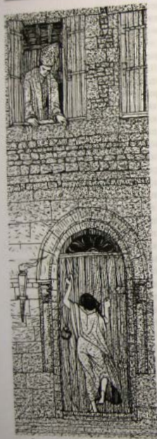
«Доколе ты будешь спать, епископ?»

Колотая руками и ногами в запертые двери, она кричала: «Доколе ты будешь спать, епископ? Зачем ты пренебрегаешь своей спутницей? Почему ты глух к наставлениям Павла? Ведь это он писал: «Не уклоняйтесь друг от друга, чтобы не искушал вас сатана». Видишь, я возвращаюсь к тебе и прибегаю не к чужому, а к собственному сосуду».