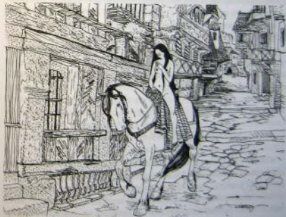
Леди Годива сняла одежду и вышла в город

О таком богоугодном поведении свидетельствует история жены графа Леофрика (968–1057) — леди Годивы. Она была доброй, милосердной и необычайно красивой женщиной. Супруг же ее был суров и жаден, постоянно облагал непосильными налогами жителей города Ковентри. Из сострадания к людям графиня несколько раз умоляла мужа снизить налоги. Устав от ее настойчивости, Леофрик поставил условие: если жена согласится проехать верхом на коне по улицам города обнаженной, то он отменит введенные налоги. Леди Годива сняла одежду и вышла в город. В это время все жители закрыли свои ставни, дабы не смущать милостивую графиню.