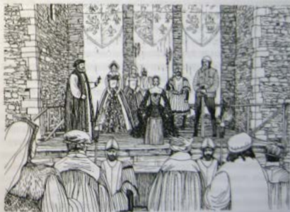
Король Анна Болейн

Однако брак с Болейн оказался недолговечным. 7 сентября 1533 года Анна родила дочь, названную Елизаветой. Король ждал наследника, а две последующие беременности королевы закончились выкидышами. Генрих был разочарован и стал заглядываться на фрейлину Джейн Сеймур. Против Анны было сфабриковано дело о заговоре и супружеской измене. Архиепископ Кентерберийский по просьбе короля очень быстро расторг этот брак, но тем самым нарушил прежний его указ о престолонаследии. От неминуемого наказания его спас новый указ законопослушного монарха, согласно которому подтверждалась виновность всех, кто протестовал против брака Генриха и Анны раньше, и освобождались от обвинения те, кто осуждал этот союз в последнее время, руководствуясь лучшими намерениями. Изменниками теперь признавались все, кто посмеет усомниться в законности обоих королевских разводов.