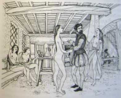
Проституция — вынужденное зло

Хозяевам и зрителям домов терпимости, да и самим проституткам строжайше запрещалось принимать и обслуживать женатых мужчин, евреев и лиц духовного звания. Как правило, данный запрет не давал желаемого результата, поскольку именно такие «тайные посетители» платили больше и были наиболее желанными клиентами.