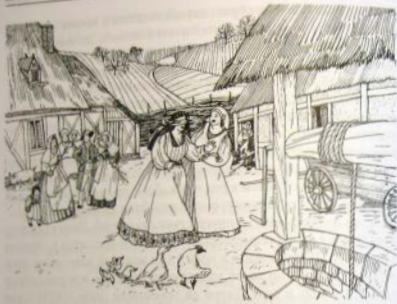
Молодой жене завязывали глаза и подводили ее к домовым хозяйственным постройкам

Грациано, опираясь на тексты Священного Писания о том, что «прилепится жена к мужу своему и будут два во едину плоть», утверждал, что акт физического соединения мужчины и женщины придает совершенство отношениям и венчает их брак. «Там, где должно быть единение тел, должно быть и единение духа» 12 . Молодая пара, наслаждающаяся плотским соитием и ощущающая духовную привязанность друг к другу, «должна быть названа не развратниками, а супругами» 13 . Эти положения каноника логично увязывались с теорией христианской этики, но плохо согласовывались с практическими реалиями жизни. Далеко не всегда можно было отличить тайный неформальный брак от различных форм легкомысленных сексуальных связей, которые были столь характерны для древнего периода варварства и распада Римской