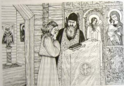
Двагода сухо есть!

недопустимыми и такие эротические ласки, как петтинг, минет и куннилингус. Церковным наказаниям подвергались те, кто «целовал, язык затолкнув в рот», «вступил на ногу с похотью», «тыкал лобом жене сквозь одежду рукою. Кто соромные уды дает лбызавлоно жене сквозь одежду рукою. Кто соромные уды жен своих — два тн женам своим и сами лбызают соромные уды жен своих — два года сухо есть» 86 .