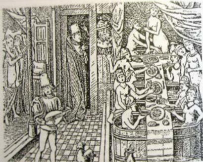
Публичная баня (С гравюры 1470 г.)

Кроме общих парных и бассейнов к услугам посетителей были двухместные ванны, где мужчины и женщины могли наслаждаться обществом друг друга. Изображения таких ванн сохранились в бургундских миниатюрах. На стоящие в ряд ванны положена длинная и широкая доска, накрытая скатертью. На ней кувшины с вином, вазы с фруктами. Обнаженные мужчины и женщины сидят за этим общим столом, пьют и вкушают яства.