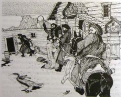
Опричники в боярском дворе

Опричники — в черных одеждах, на вороных конях — вершили правосудие по своему произволу. К седлам были привязаны собачьи головы и мёлы, символизовавшие выслеживание изменников и выметание из Руси всякой скверны.