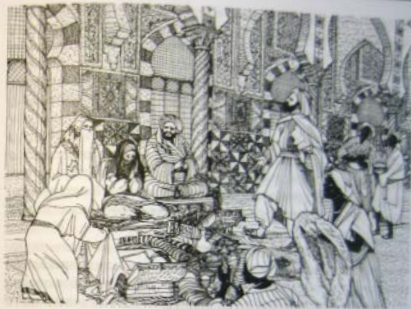
Махр — свадебный дар жениха

В случае удачного сватовства и знакомства сторона невесты приглашала сватов и родителей жениха на сговор-помолвку, где в подтверждение обоюдного согласия на брак за обильным угощением стороны обменивались подарками. Сторона жениха передавала требуемый калым, подарки родителям невесты, а те в свою очередь — подарки для жениха и его родителей. Стороны оговаривали размер и содержание махра — свадебного дара жениха, который, в отличие от калыма, не уходил в семью родителей, а целиком принадлежал невесте. В Коране сказано: «И давайте женам их махр в дар. Если же они соглашались чем-нибудь из этого для вас, то питайтесь этим на здоровье и благополучие» (сура 4 «Женщины», аят 4). При этом хадисы предостерегают: «Посланник Аллаха сказал: «Не жди добра, если женщина требует богатого махра и обладает дурным характером» (Бихар аль-анвар, т. 58, с. 321).