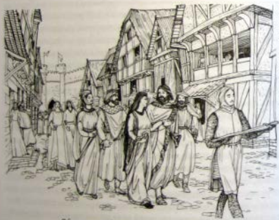
Обручению предшествовал «выход невесты»

Стараниями духовенства к концу I тысячелетия идея брака как церковного таинства стала овладевать сознанием людей. Однако участие церкви в брачной церемонии еще долгое время было необязательным и никак не влияло на признание брака действительным. Получение свадебного благословения от священнослужителя было скорее исключением, чем правилом. Лишь к концу Средневековья, в XV веке, церковные обручение и венчание стали общепризнанной нормой, а постановление об обязательном церковном обряде, делавшее брак вполне законным, было принято в начале эпохи Ренессанса, на Тридентском соборе 1545–1563 годов.