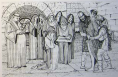
Несчастная была принуждена кастрировать своего любовника

«Пав с молодым каноником, который был духовным наставником сестер, она поняла, что беременна. Другие сестры, боясь, как бы на орден не пала немилость, дали любовнику лестницу. Он бежал, был схвачен и привезен назад в Уоттон, где в присутствии других сестер несчастная была принуждена кастрировать своего любовника» 22 .