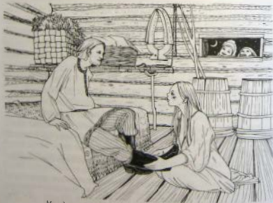
Молодая жена обязана была снять с ног супруга сапоги

Оставшись запертыми у брачного ложа, новобрачные угощались хлебом и курицей, дабы эта пища укрепила их силы. После еды молодая жена обязана была снять с ног супруга сапоги, демонстрируя тем самым смирение перед ним и готовность во всем его слушаться. Также она спрашивала у мужа дозволения лечь с ним. Оказавшись в постели, молодые предавались плотскому исполнению своего супружеского долга.