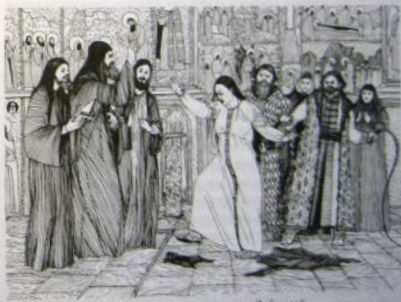
Постриг царицы Соломонии Сабуровой

Варлаам. Все трое попали в опалу. Патрикеев с Греком были сосланы в отдаленные монастыри, а Варлаам, впервые за всю историю православной церкви, был лишен сана. Княгиня Соломония была обвинена в колдовстве и пострижена в московском Богородице Рождественском монастыре. Государству нужен был наследник, и новый митрополит Даниил не противился решению князя о разводе. Народу было объявлено, что, «видя не плодство из чрева своего», великая княгиня Соломония решила принять на себя чин ангельский и постричься. Однако на деле все было не совсем так. Когда митрополит, несмотря на слезы и рыдания Соломонии, обрезал ей волосы и возложил на нее монашеский куколь, она сорвала его, бросила на землю и растоптала ногами. Присутствовавший при этом думный дворянин Иван Юрьевич Шигон-Поджогин ударил великую княгиню плетью, после чего она уразумела бесполезность своего протеста и приняла постриг под именем София. В молитвах она просила Господа покарать ее обидчиков.