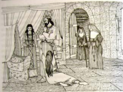
Хильперiku пришлось отправить Авдоверу в монастырь

Св. Григорий Турский так описывает эти события: «Узнав об этом, король Хильперик, хотя у него уже было несколько жен, решил просить руки Галесвинты, сестры Брунгильды. Он сказал послам, что обещает оставить всех других жен, если только женится на королевской дочери равного с ним ранга. Отец Галесвинты поверил ему и послал к нему свою дочь с огромным приданым, поступив точно так же, как в свое время он отправлял Брунгильду.