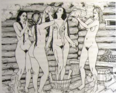
Подружки обмывали невесту у молоком с медом

и обмывали молоком с медом. Затем это молоко добавляли в тесто для свадебного пирога, которым угощали гостей.