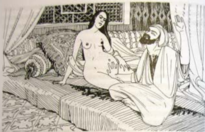
О Господь мой! Именем Пророка молю тебя произвести из этого плода мальчика!

О подобных способах писал и шейх Нефзауи: «Мудрецы и ученые (да смилуется над ними Господь!) говорили: "Если кто возложит руку на лобок беременной жены и произнесет следующие слова: 'Во имя Аллаха! Да пребудет он милостив к Пророку, и да пребудет с ним молитва Пророка. О Господь мой! Именем Пророка молю тебя произвести из этого плода мальчика', — молитва эта достигнет слуха нашего Господа и придется по душе господину нашему Мухаммеду (да пребудет с ним хвала и милость Аллаха) — и жена породит тебе мальчика» 35 .