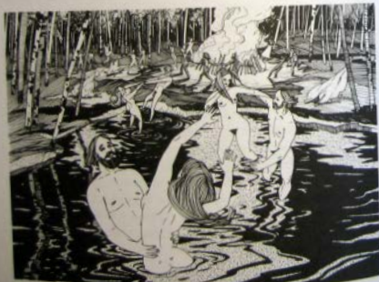
Все веселились безудержно и развратно

огня, добытого трением. Такой огонь считался священным и очищал тело и душу от всякой скверны, болезней и нечистой силы. Молодые блудницы вместе со своими возлюбленными прыгали сквозь огонь парами, и если их руки не расцеплялись, то это было добрым знаком о скором замужестве. Некоторые, чтобы очиститься и быть здоровыми, перепрыгивали нагими. Возле костров играли в игры довольно непристойного содержания, мужчины и женщины целовали друг друга в скоромные места. В общем, все веселились безудержно и развратно. Праздник этот особенно любили незамужние, засидевшиеся в Девках селянки, поскольку в купальскую ночь они легко могли расстаться с девственностью и даже зачать потомство. Полностью обнажаясь, они бежали во круг засеянных полей, соблазняя мужчин укрыться с ними во ржи или ближайшем перелеске. Там в темноте выбирались случайные партнеры, а то и несколько, дабы творить с ними всевозможные любовные непотребства. Девушки и молодые замужние женщины отдавались мужчинам без колебаний и без разбору.