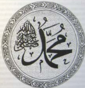
Мухаммед — пророк Аллаха

религии и опасались усиления ее сторонников. После смерти дяди Абу Талиба, бывшего главой племени курайшитов, Мухаммед лишился какой-либо внутренней опоры в Мекке и в 622 году вместе со своими немногочисленными последователями отправился в соседнюю Медину, соперничавшую с Меккой. Мединцы охотно приняли Мухаммеда и его сторонников. Учение пророка о Едином Всемоущем и Всемилолюбившем Боге было воспринято ими весьма благосклонно, и вскоре чуть ли не все жители этого города прикнули к правоверным. Этот огромный успех 622 года был отмечен как начало новой мусульманской эры (по-арабски — хиджра).