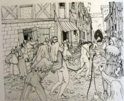
Такое наказание доставляло немалые мучения

Такое наказание доставляло немалые мучения женщине и самым серьезным образом угрожало мужскому достоинству ее любовника. Этим достигался эффект имитации кастрации, приводившей не только к унижению мужчины, но к символическому лишению его половой идентичности.