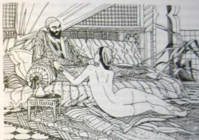
Жена радуется своему мужу, когда он смотрит на нее и она повинуется ему

Женщина была обязана удовлетворять сексуальные желания мужа и господина и во время менструального цикла. Такое сношение не было халальным действием, поэтому мужчины следовало заплатить за него небольшой штраф. Это следует из содержания 264-го хадиса 1-й книги Сунаана Абу Дауда. «Рассказал Абдулла ибн Аббас: Пророк (мир ему) сказал о человеке, который имел сношения со своей женой во время ее менструации: «Он должен дать один динар или половину динара в подаяние». Цена в один динар устанавливалась за сношение с женщиной в первую половину цикла, а полдинара — за половую связь в конце менструации.