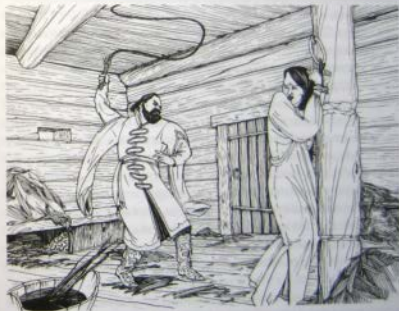
Почтение по Домострою

В соответствии с подобными воззрениями на сущность жен супружеские отношения в семье носили ярко выраженный деспотический характер, а патриархальный уклад семьи предоставлял мужу как хозяину двора неограниченную власть над женами и всеми домочадцами. Вся их жизнь протекала под его строгим надзором. По свидетельству Н. И. Костомарова: «Обращение мужьев с женами было таково: по обыкновению, у мужа висела плеть, исключительно назначенная для жены и называемая дурак; за ничтожную вину муж таскал жену за волосы, раздевал донага; привязывал веревками, сек дураком до крови — это называлось учить жену; у иных мужьев вместо плети играли ту же роль розги, и жену секли, как маленького ребенка, а у других, напротив, дубина — и жену били, как скотину» 58 .