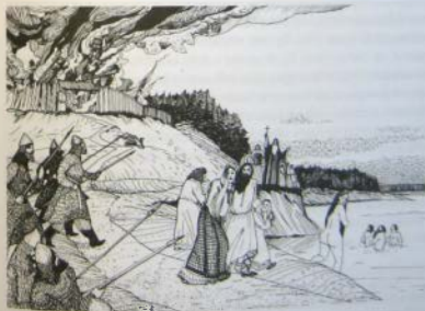
Крещение огнем и мечом!

В лето 6496 года от сотворения мира и в 988 году от Рождества Христова по решению и просьбе великого князя Владимира Святославича патриарх Константинопольский Николай II Христоверг отправил в Киев духовную миссию во главе со святителем Михаилом для крещения Руси. Византийские священники массово крестили людей в водах Днепра и Почайны. Затем, где увещанием слова Божьего, а где жестоким принуждением, крещению подверглись и другие русские земли. Сопротивление насильной христианизации людей было порой весьма сильным и долгим. Так, например, Новгород приводили к «истинной вере» огнем и мечом киевский воевода Добрыня и тысяцкий Путята. Сломить людей новгородских, верных своим старым богам, удалось лишь в 990 году. В Ростове и Муроме сопротивление введению христианства продолжалось вплоть до XII века.