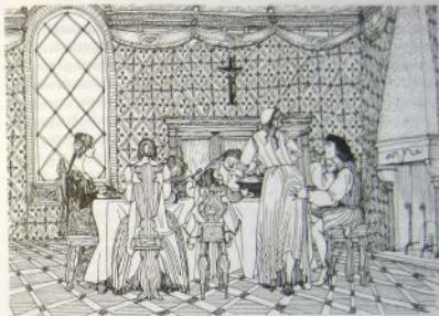
Буонаррото разрешил жене взять в дом служанку

Подобные отношения в эпоху Ренессанса встречались редко и были скорее исключением из правил. Женатые мужчины предпочитали удовлетворять свои желания со служанками. Так, например, брат Микеланджело — Буонаррото — разрешил жене взять в дом служанку, но только при условии, что та будет молодой и красивой. Естественно, он рассчитывал на то, что супруга спустит ему с рук такое откровенное, но совершенно обычное нарушение супружеской верности прямо под крышей собственного дома.