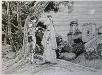
Откачать на чистое чистотам

Такое поведение женщины несколько не противоречило правилам возвышенной любовной романтики. Дама, получив достаточное количество знаков внимания со стороны пылкого поклонника, должна была уступить ему, поскольку любовь создана Богом и пренебрегать ею было недостойно, несправедливо и грешно.