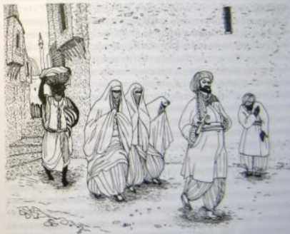
Мужчины обладали абсолютным превосходством перед женщинами

Как правверный мусульманин был покорен Аллаху, так и его жены должны были быть покорны ему. В исламе мужчины обладали абсолютным превосходством перед женщинами и в семье имели статус господина и повелителя. Женщины были обязаны уступать им дорогу и не имели права обгонять их.