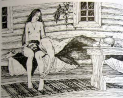
Утешающая праведна и безгрешна

Церковное признание женщины, утешающей оставленного законной женой мужа, как безгрешной и праведной позволяло ей вступать в брак с этим мужчиной, а его первая жена утрачивала возможность восстановления отношений, поскольку «их брак будет запрещен».