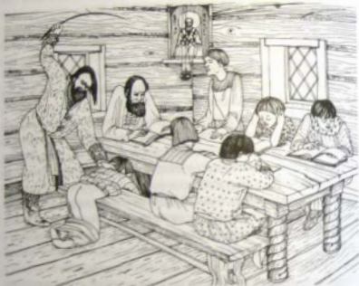
Обучение грамоте, внимание и усидчивости

к чтению часослова и Псалтыря. Такое образование требовало от учащихся большого внимания и усидчивости, которые прививались им не только словесным увещанием, но и розгами. Учителя имели право пороть своих подопечных, и потому нерадивых учеников постоянно призывали «блюстись наказания Дидаскала».