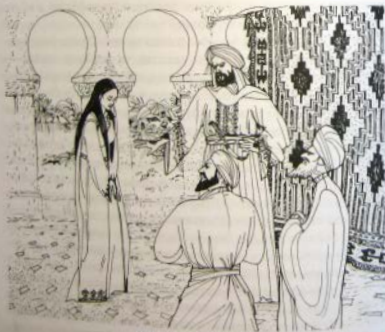
Тааки! Тааки! Тааки!

В случае подтверждения беременности жена оставалась в доме бывшего мужа до рождения ребенка, который затем оставался в доме отца. Данный период в течение как минимум трех месяцев после развода или смерти мужа назывался «идда». В это время женщина не имела права выйти замуж за другого мужчину. Замужество сразу по расторжении брака дозволялось только женщинам до девяти лет и вдовам старше 50 лет, так как в это время они не могли иметь детей, а поэтому не требовалось ожидать истечения срока, установленного шариатом для разводов.