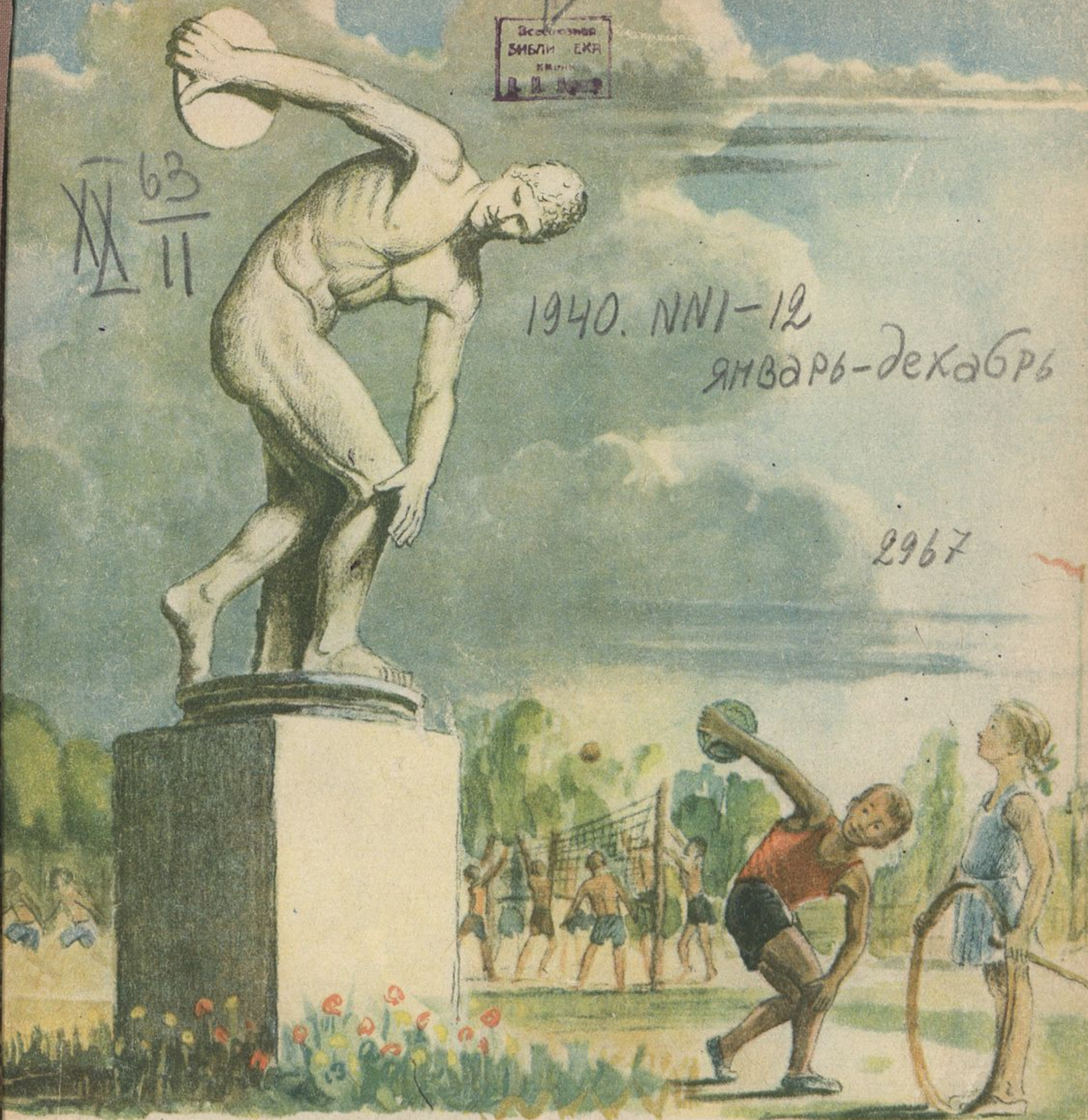
Иснобол. Скульптура метателя диска — одно из великих творений древнегреческого ваятеля Мирона.